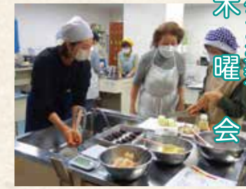
パンとお菓子 木曜会