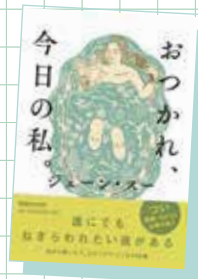
おつかれ、今日の私。 ジェーン・スー (マガジンハウス)