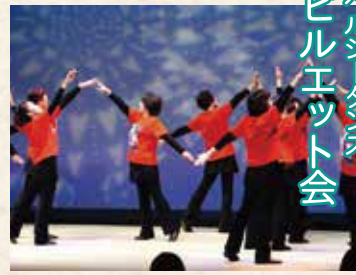
ヘルシーダンス ピルエット会