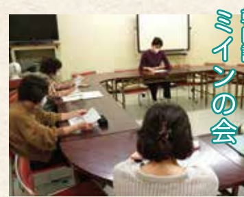
韓国語 ミインの会