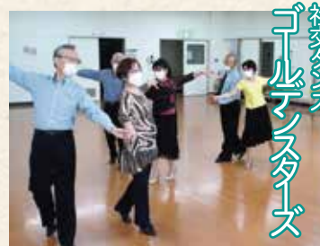
社交ダンス ゴールドステップ