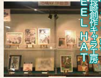
キャラクター創作 長崎創作キャラクター EELHAT