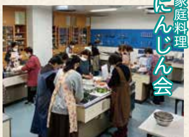
家庭料理 にんじん会