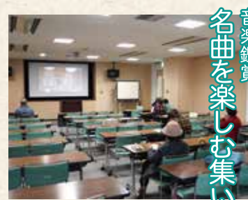
音楽鑑賞 名曲を楽しむ集い