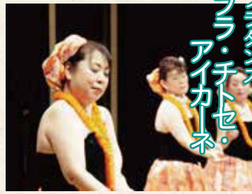
フラダンス フラ・イチセ・アイカセ