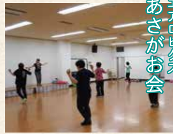
エアロビクス あさがお会