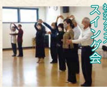
社交ダンス スイング会