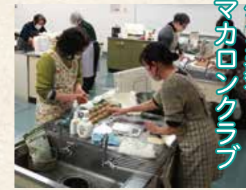
パンとお菓子 マカロニクラブ