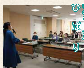
歌のサークル ひばり