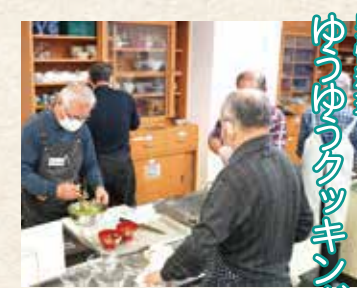
男性料理 ゆづりゆづりツッキング