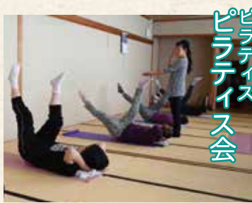
ピラティス会 ピラティス