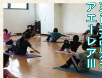
ソフトエアロビクス エアトレアIII