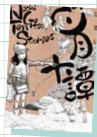
日月十譚 マテウシュ・ウルバノヴィチほか (トゥーヴァージズ)