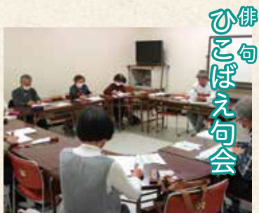
俳句 ひこばえ句会

長崎市北公民館では学習の目的を同じくする人たちがグループを組んで、自主的な学習を年間を通して行っています。なんとその数41団体！所属している方の数は700人以上！今回はその全てを一挙にご紹介します。この春から参加することもできますよ！