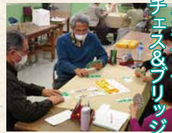
トランクゲーム チェス&ブリッジ