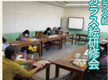
ガラス絵 ガラス絵研修会