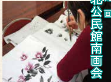
南画 北公民館南画会