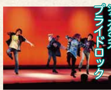
ジャズダンス プライドロック