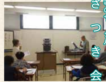
歌のサークル さつき会