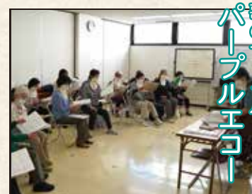
歌のサークル パールエコー