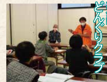
英会話 どんぐりクラブ