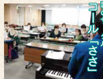
歌のサークル 「ヨル」