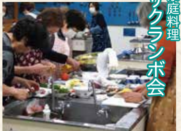
家庭料理 サクランボ会