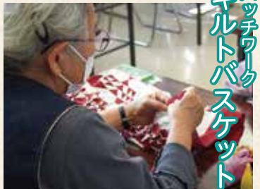
パッチワーク キルトバスケット