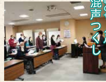
歌のサークル 混声つくし