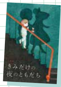
きみだけの夜のともだち セング・ソウン・ラタナヴァン 西加奈子(訳) (ポプラ社)