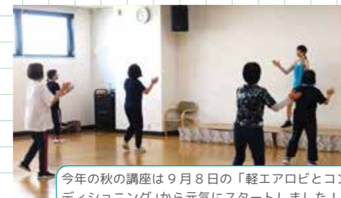
今年の秋の講座は9月8日の「軽エアロビとコンディショニング」から元気にスタートしました！！