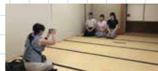
当日は北公民館の和室やチトセピアホールも取材いただきました！