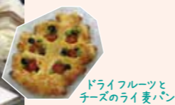
ドライフルーツとチーズのライ麦パン

“おつまみにもおやつにもなる”をコンセプトに、クリスマスやパーティーにも合うパンを全3回の講座で学びました。