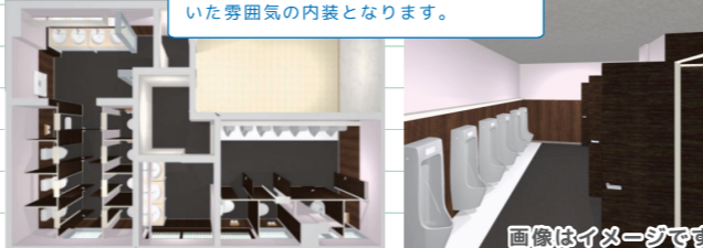
ホールはブラウンを基調とした落ち着いた雰囲気の内装となります。

北公民館につづいてチトセピアホールのトイレも新しくなります! 改修工事は4月1日(月)から着工し、4月末に完成の予定です。こちらもご期待ください!