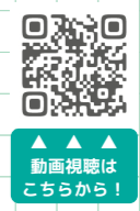
動画視聴はこちらから!

『月刊公民館』2月号は論考と座談会、北公民館まつりレポートで計30ページの大特集! 読み応えあり、です!!