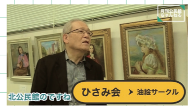
北公民館のですね ひさみ会 > 油絵サークル