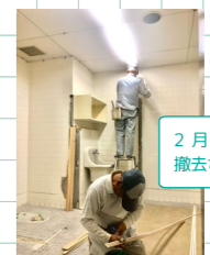
2月2日、今まで使い込まれた壁や内装が撤去されました。これから施工に入ります。