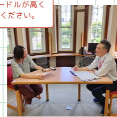
事業報告や決算作業はなかなかハードルが高く思ってしまうもの。お気軽にご相談ください。