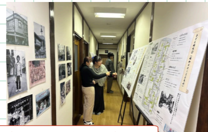
新大工町自治会さんからご提供いただいたパネルは情報満載! じっくりご覧ください!!

新大工町自治会さんに協力いただき、昭和初期から平成にかけての街並みの変遷、映画館、仮装パレード、長崎くんち、そして子ども時代の思い出などを撮影した写真展を開催します。「懐かしい新大工」がいっぱい! 観覧無料ですのでぜひご来館ください。