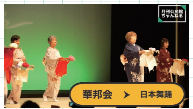
華邦会 > 日本舞踊

『月刊公民館』2月号は論考と座談会、北公民館まつりレポートで計30ページの大特集! 読み応えあり、です!!