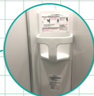
チャイルドチェア